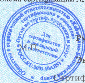
Схема сертификации № 1с.